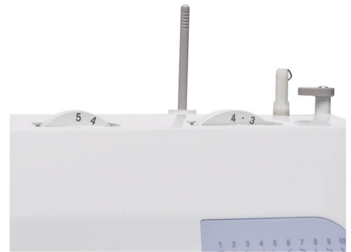
線跡長度及闊度控制

提供多款不同的配件以供選購，包括厚棉繡花壓布靴等。 詳情請參閱 www.brother.com.hk