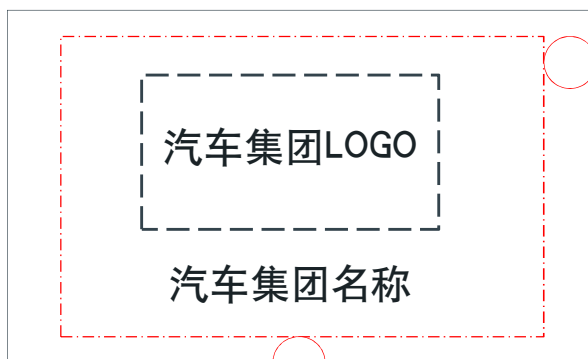
示例2 Example 2